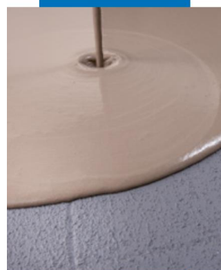
Полагане на самонивелираща подравняваща смес Ultraplano върху сух слой Eco Prim Grip, положен върху стар под