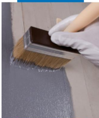
Полагане на Eco Prim Grip върху бетон с четка