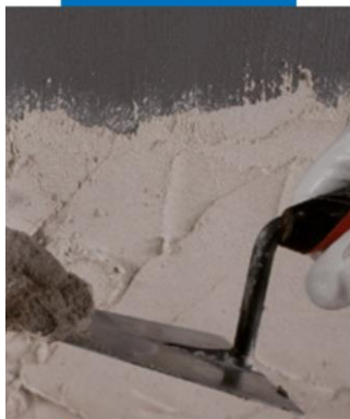
Полагане на мазилка върху Eco Prim Grip